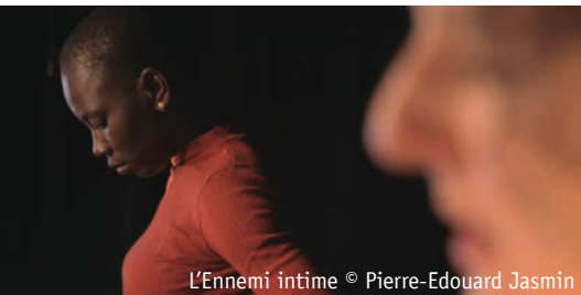
L'Ennemi intime © Pierre-Edouard Jasmin

La Vénérie/Ecuries 3 place Gilson, 1170 Bruxelles Infos et réservations : 02 672 14 39